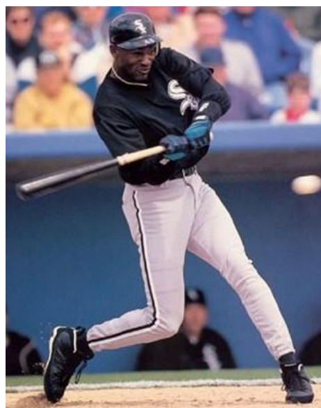
MJ chez les White Sox avec les AJ9 à crampons (moins brillant aux swings qu'aux dunks!)

Si l'AJ9 restera dans l'histoire, paradoxalement, c'est donc pour avoir été la première paire de la gamme dans laquelle MJ n'a pas joué.