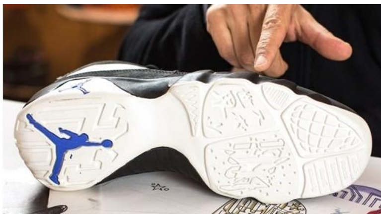
Semelle de la AJ9