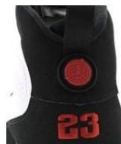
Talon de la AJ9

Bon, et maintenant, on en fait quoi de cette paire de basket, on la sort ou on la laisse au placard? Parce que je vous rappelle quand même que le but de Nike est de vendre ses produits au grand public et pas seulement d'équiper ses sportifs sous contrats. Seulement, sans MJ comme ambassadeur on n'est pas sûr du succès de la paire.