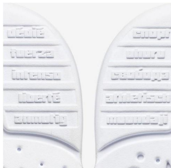
Détails de la semelle

Bon, et maintenant, on en fait quoi de cette paire de basket, on la sort ou on la laisse au placard? Parce que je vous rappelle quand même que le but de Nike est de vendre ses produits au grand public et pas seulement d'équiper ses sportifs sous contrats. Seulement, sans MJ comme ambassadeur on n'est pas sûr du succès de la paire.