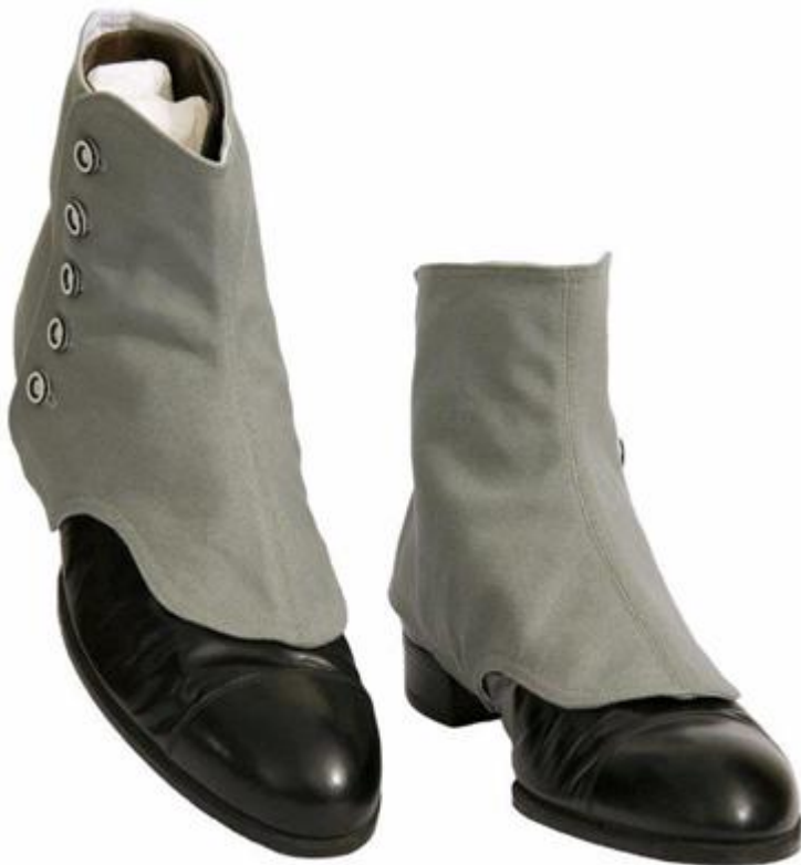
Paire de guêtres des années 1920.

La AJ13 serait aussi pour de nombreux spécialistes l'un des modèles les plus confortables de la gamme et embarque les désormais reconnus systèmes technologiques que sont la semelle intermédiaire en carbone Phylon et de l'amorti Zoom Air connus sur les précédents modèles. Le produit final est peut-être le meilleur équilibre entre performances sur le terrain et look attrayant au sein de la gamme Air Jordan encore à ce jour. Sortie fin 1997 et courant 1998, la AJ13 était disponible à la vente en 5 coloris différents.