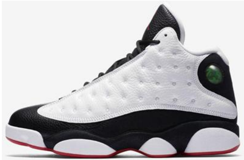
AJ13 Black Toe

Au niveau du talon se trouve un hologramme circulaire qui laisse apparaître la superposition du numéro 23, d'un ballon de basket et du logo Jumpman. Cet hologramme symbolise l'œil de la panthère.