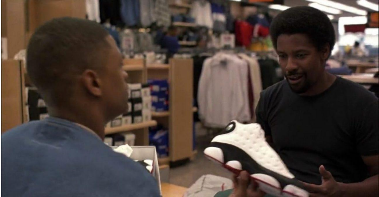
Denzel Washington achète une paire de AJ13 Black Toe dans « He got game »

l'université «Big State», se rend dans un magasin de baskets pour acheter les dernières Air Jordan.