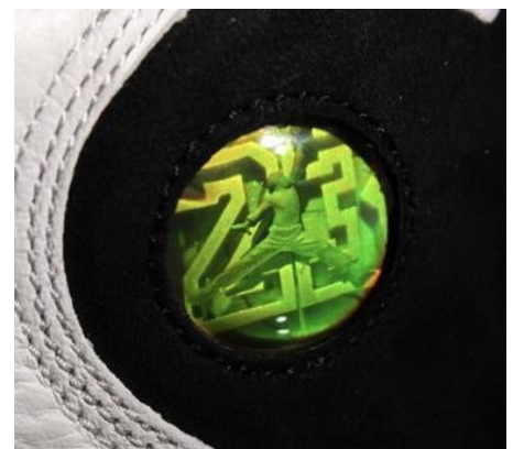
« L'œil de la panthère »

Le mélange de cuir lisse et d'un empîecement en cuir contrasté, grainé et capitonné rappelant une guêtre de dandy des années 20, donne un air très élégant à la paire.