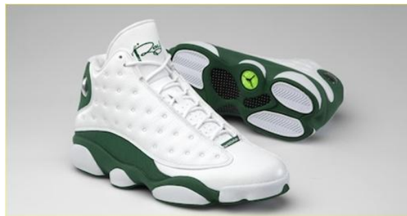
AJ13 « Celtics » PE Ray Allen

Sûrement en raison du confort bien connu de la chaussure, la AJ13 a toujours été un choix populaire pour les basketteurs professionnels. Ray Allen peut revendiquer les AJ13 PE (player exclusive) les plus célèbres, aux couleurs de Boston Celtics qui n'ont en fait été disponibles à la vente au public qu'en 2011.