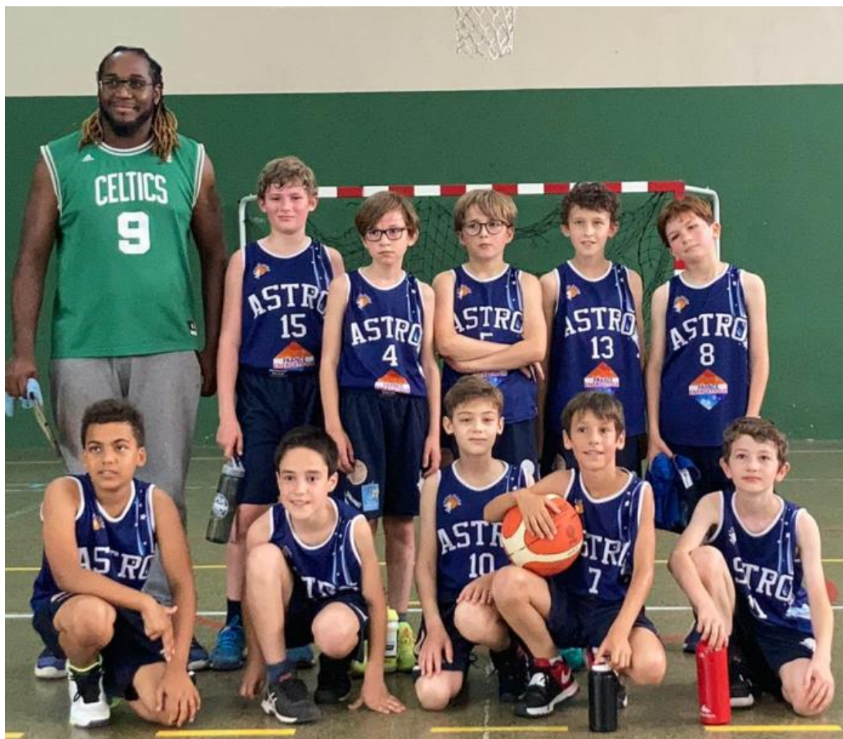
Nos U11M à Villemur