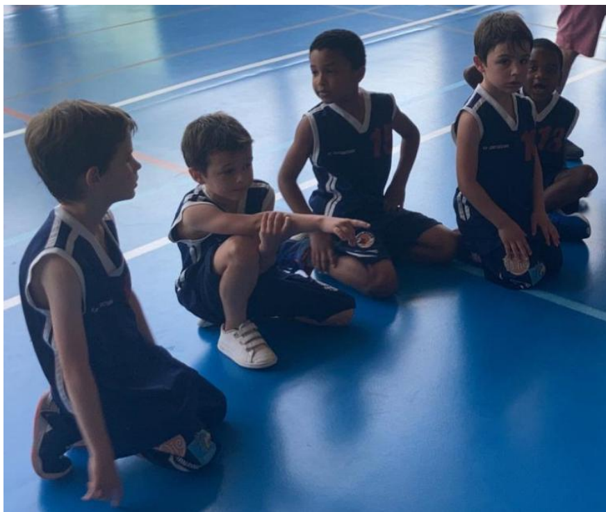
Nos U7 à Launaguet